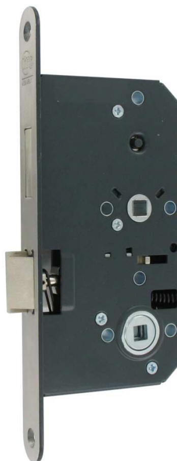
A85 D5 Serrure toilette