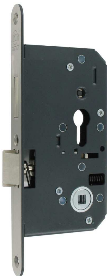
A86 D5 Serrure à cylindre